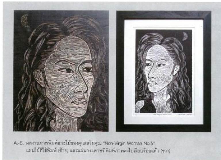
A-B. ผลงานภาพพิมพ์แกะไม้ของคุณเสริมคุณ "Non-Virgin Woman No.5" แผ่นไม้ที่ใช้พิมพ์ (ซ้าย) และแผ่นกระดาษที่พิมพ์ภาพลงไปเรียบร้อยแล้ว (ขวา)

และสุดท้าย คุณจก ผู้มีผลงานศิลปะมากมายหลายแขนง ทั้งถ่ายภาพ เขียนหนังสือ ประพันธ์บทเพลง วาดเส้น จนมาถึงงานแกะไม้ แต่กลับให้นิยามตัวเองไว้ว่าเป็นเพียงคนที่รักในศิลปะ ทั้งในฐานะผู้สร้างงาน และในฐานะผู้สนับสนุนวงการศิลปะเท่านั้น มีสิ่งที่จะฝากถึงคนรุ่นใหม่ในวงการศิลปะบ้านเราครับ “ก็เหมือนที่ อ.จักรพันธ์ุ เนนะนาม อ้อ คุณเสริม